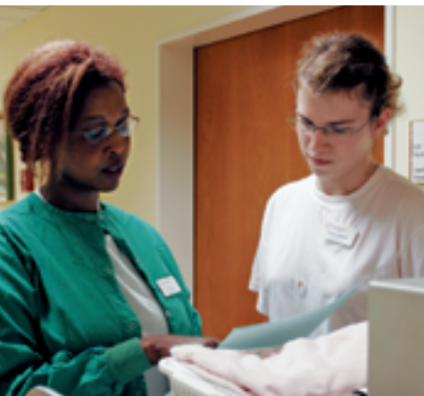
Gesprächsbedarf: Kommunikation im Alltag.

sächlich um eine ethische Frage? Worin besteht der Konflikt, wie lautet das ethische Problem? Wer sind die relevanten Beteiligten, und welche Werte sind tangiert, was wissen wir über die Weltanschauung des betroffenen Heimbewohners? Welche Handlungsoptionen gibt es?